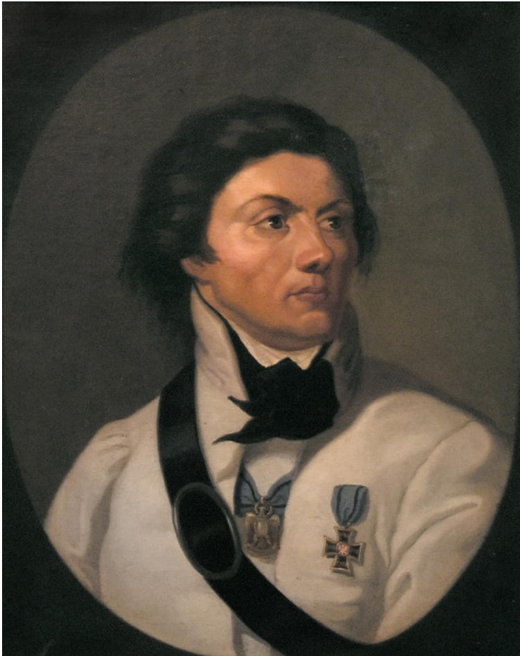
Portret Tadeusza Kościuszki, autor nieznany, ok. 1840, Muzeum Narodowe