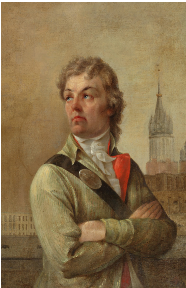
Portret Tadeusza Kościuszki, mal. Jan Nepomucen Bizański, 1862, Muzeum Krakowa