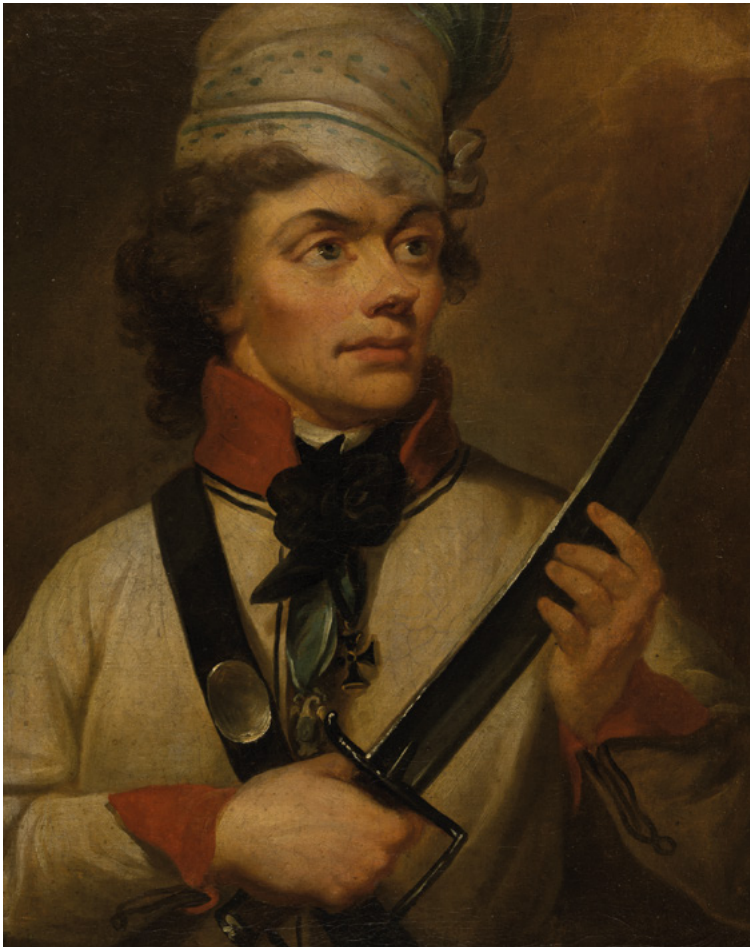
Portret Tadeusza Kościuszki, mal. Kazimierz Wojniakowski, 1794, Poznańskie Towarzystwo Przyjaciół Nauk, Muzeum Narodowe w Poznaniu