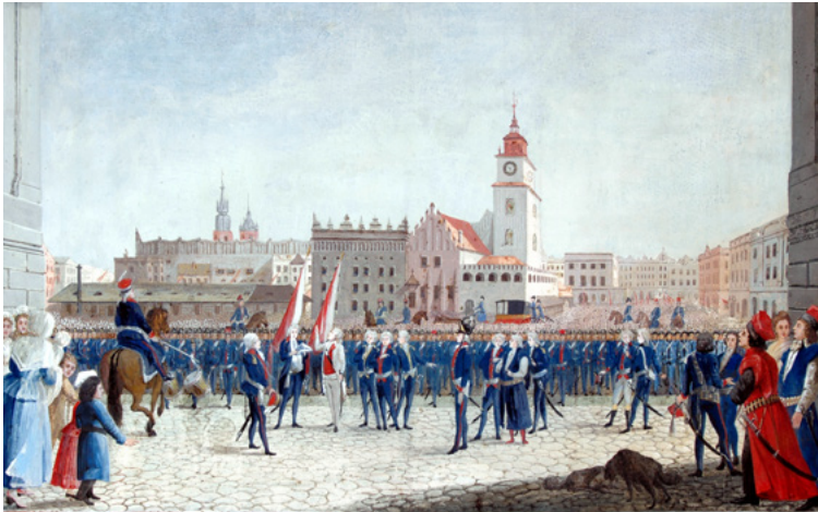
Przysięga Tadeusza Kościuszki na Rynku Krakowskim, mal. Michał Stachowicz, 1797, Muzeum Krakowa

realizował plan ocalenia Polski, podejmując działania polityczne w dwu płaszczyznach – polityce wewnętrznej oraz zagranicznej. Naczelnik był odpowiedzialny nie tylko za stronę militarną powstania, a więc stworzenie powstańczej armii i dowodzenie nią w walce, ale także za funkcjonowanie państwa. Kościuszko kierował się wymogami racji stanu walczącej Polski, był zwolennikiem poszukiwania kompromisu, unikał radykalnych działań. Był przeciwnikiem twardej ręki, radykalnych jakobińskich metod i rozprawy z królem. Uważał, że zdrajców należy karać zgodnie z prawem, odrzucał jednak samosądy i niekontrolowane wybuchy gniewu ludu. Starał się pozyskać dla sprawy polskiej poparcie ze strony całego ówczesnego społeczeństwa polskiego, zarówno warstw uprzywilejowanych, jak szlachta czy duchowieństwo, jak też najliczniejszej ale przy tym najbardziej upośledzonej – chłopstwa. Kwestię tę w powstaniu miał rozwiązać wydany przez Kościuszkę, 7 maja 1794 r. „Uniwersał połaniecki”. Dokument ten wprowadził wolność osobistą chłopów, którzy tworzyli większość społeczeństwa. Ponadto zapewniał im nieusuwalność