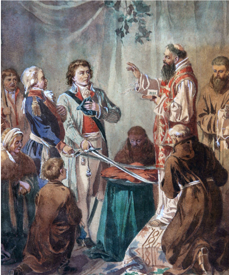
Scena poświęcenia szabel Tadeusza Kościuszki i gen. Józefa Wodzickiego, mal. Walery Elias Radzikowski, 2 poł. XIX w., Muzeum Krakowa

liczebności wojsk i stworzenia struktury administracyjnej. Brakowało wszystkiego: kadry oficerskiej i podoficerskiej, broni palnej i białej, mundurów, żywności, środków finansowych, a wreszcie samych rekrutów. Z powodu braku broni palnej powstańców uzbrojono w kosy i piki. Głównym celem Kościuszki po objęciu dowództwa powstania było