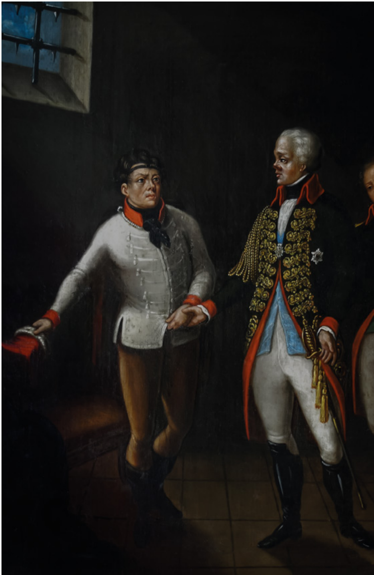
Uwolnienie Tadeusza Kościuszki z twierdzy pietropawłowskiej 26 X 1796, środowisko wileńskie, I poł XIX w., Komitet Kopca Kościuszki w Krakowie