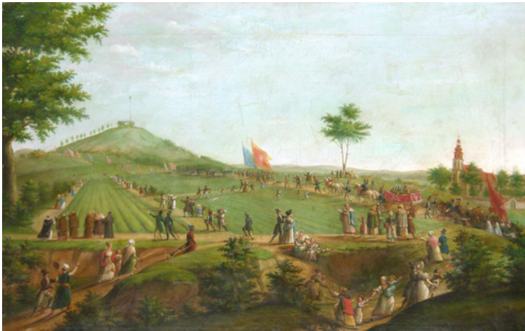
Pochód z ziemią śpod Raclawic na Kopiec Kościuszki w Krakowie, mal. Teodor Baltazar Stachowicz, 1859, Muzeum Krakowa

uczucia patriotyczne i jednoczył Polaków ze wszystkich zaborów. W 2000 r. w przestrzeniach zabytkowego Bastionu V w Forcie nr 2 „Kościuszko” sąsiadującego z Kopcem Kościuszki w Krakowie otwarto nowoczesną wystawę stałą „Kościuszko – bohater wciąż potrzebny”. Ekspozycja ma charakter narracyjny. Jej istotą jest opowieść, która odwołując się do wiedzy, rozumu i zmysłów, posługując się artefaktami jako „aktorami”, wciąga widza w świat uniwersalnego, ponadczasowego bohatera. Jednym z celów wystawy jest rozpoznanie roli, jaką dziedzictwo Kościuszki może odegrać we współczesności.