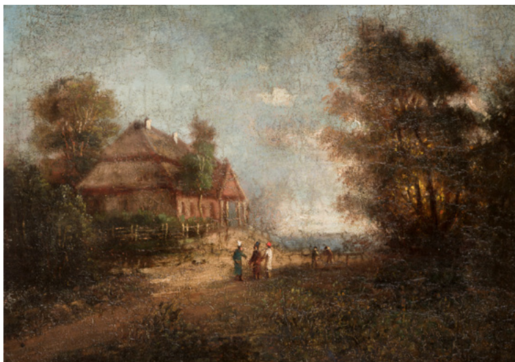
Dworek Kościuszków w Merczowszczyźnie, mal. Michał Kulesza, przed 1863, Muzeum Narodowe w Krakowie

Nauka w kolegium pijarskim w Lubieszowie.