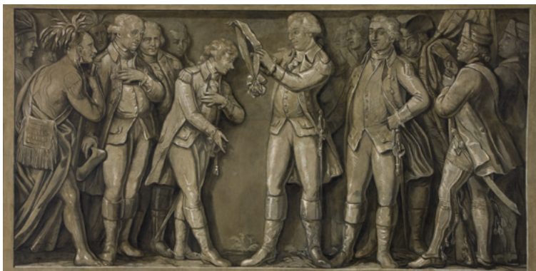
Jerzy Waszyngton odznacza Kościuszkę Orderem Cyncynata, mal. Michał Stachowicz, 1818, Muzeum Narodowe w Krakowie