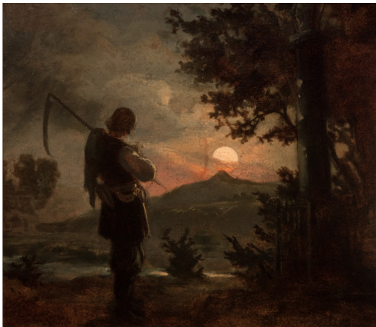
Kosiarz, mal. Aleksander Kotsis, przed 1862, Muzeum Narodowe w Krakowie

Żuraw Józef , Filozofia oświeceniowa Tadeusza Kościuszki: wybór pism , Częstochowa 2003.