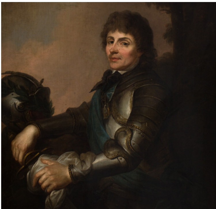
Portret Tadeusza Kościuszki w zbroi, autor nieznany, koniec XVIII w., Muzeum Narodowe w Krakowie

wojsk rosyjskich reforma ustrojowa i militarna państwa polskiego nie została zrealizowana. W styczniu 1793 r. Rosja i Prusy dokonały II rozbioru Rzeczypospolitej. Próbą ratowania państwowości było zbrojne powstanie pod wodzą generała Kościuszki, które wybuchło 24 marca 1794 r. w Krakowie. Powstańcy bohatersko przez prawie osiem miesięcy walczyli z przeważającymi wojskami rosyjskimi i pruskimi. Powstanie zostało stłumione. Konsekwencją upadku powstania był III rozbiór, przeprowadzony w 1795 r. przez Rosję, Austrię i Prusy oraz likwidacja państwowości polskiej na 123 lata.