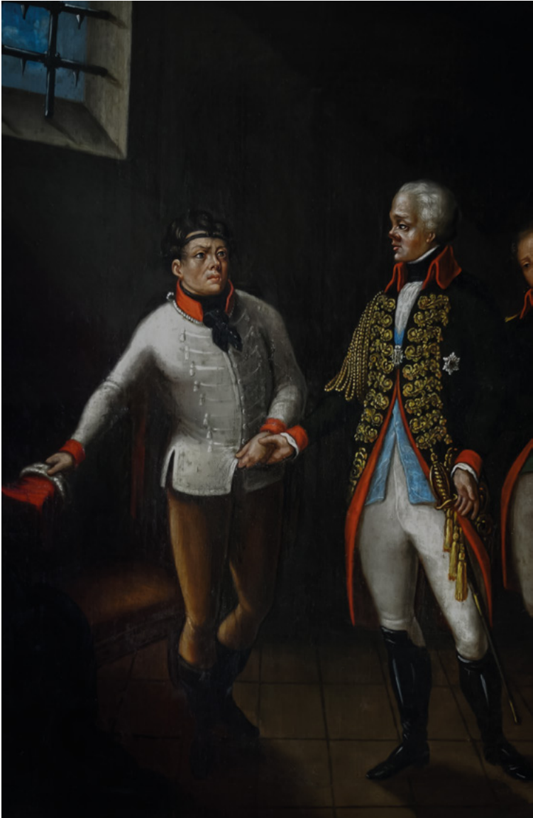
Befreiung von Tadeusz Kościuszko aus der Festung Peter und Paul am 26. Oktober 1796, Wilna-Umfeld, 1. Hälfte 19. Jh., Kościuszko-Hügel-Komitee Krakau