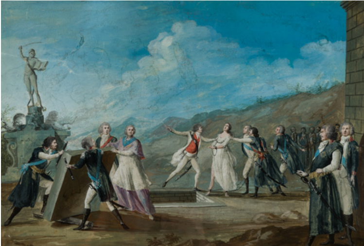
Tadeusz Kościuszko rettet Polen aus dem Grab, Gemälde von Michał Stachowicz, 18./19. Jh., Muzeum Narodowe Krakau

Kompromissen und vermied radikale Maßnahmen. Er lehnte das Prinzip der „harten Hand“, radikal-jakobinische Methoden und Maßnahmen gegen den König ab. Verräter sollten nach Gesetz bestraft werden, Selbstjustiz und unkontrollierte Wutausbrüche des Volkes lehnte er strikt ab.