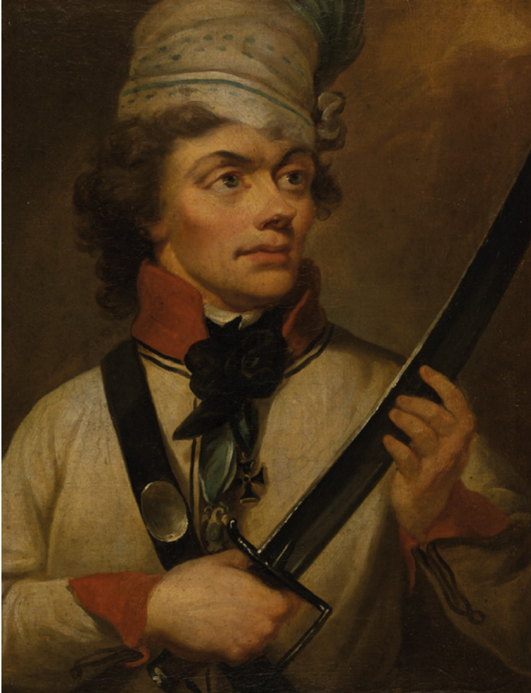
Portrait of Tadeusz Kościuszko, painted by Kazimierz Wojniakowski, 1794, Poznańskie Towarzystwo Przyjaciół Nauk, Muzeum Narodowe w Poznaniu