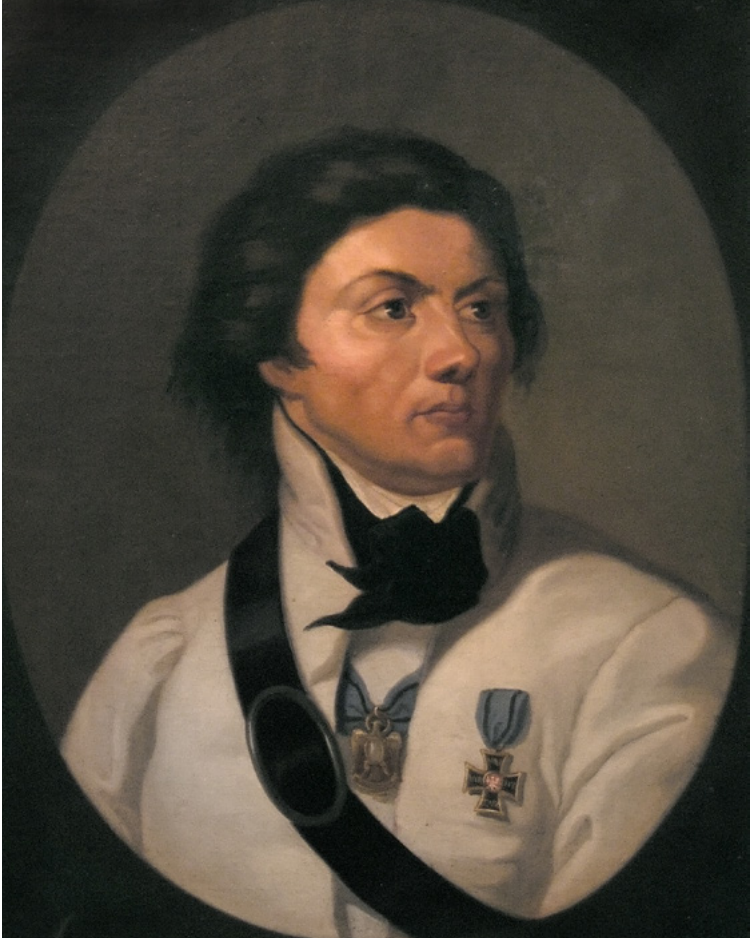
Porträt von Tadeusz Kościuszko, unbekannter Autor, um 1840, Muzeum Krakowa