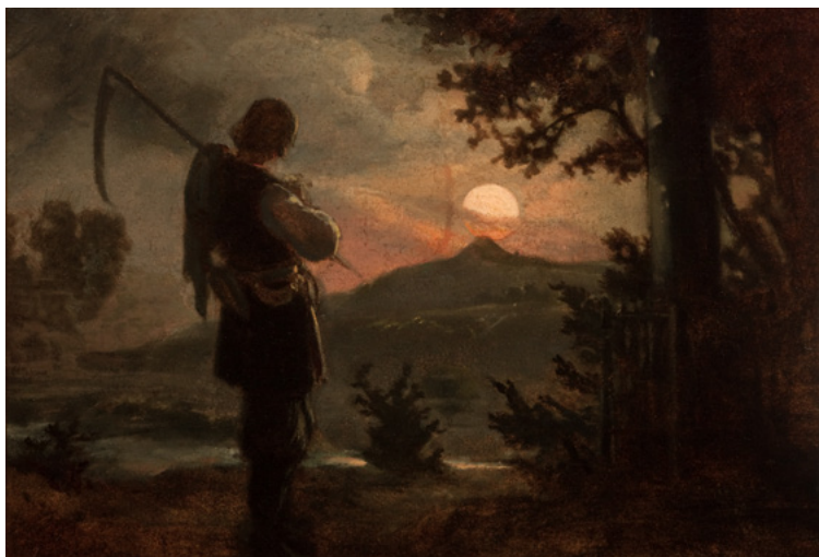
Schnitter, Malerei von Aleksander Kotsis, vor 1862, Nationalmuseum Krakau