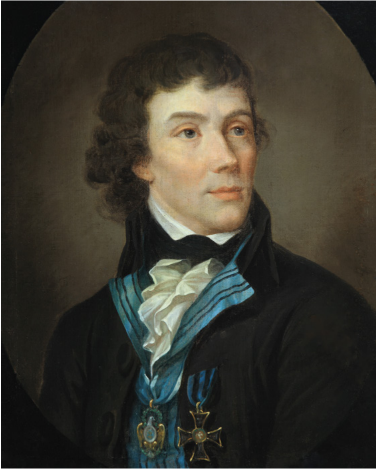
Porträt von Tadeusz Kościuszko, unbekannter Künstler, um 1800, Museum des Polnischen Heeres, Warschau