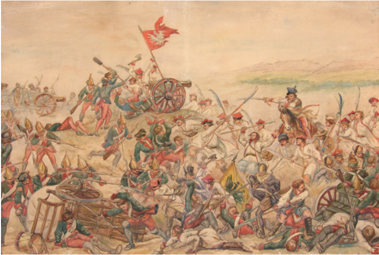
Schlacht von Raclawice, Gemälde von Walery Eliaz Radzikowski, 1895, Museum Krakau

Aufbau einer funktionsfähigen Verwaltungsstruktur. Doch es fehlte an allem: an Offizieren und Unteroffizieren, an Feuer- und Blankwaffen, an Uniformen, Lebensmitteln, finanziellen Mitteln und nicht zuletzt an Rekruten. Da es an Schusswaffen mangelte, wurden zahlreiche Aufständische mit Sensen und Spaten bewaffnet. Kościuszkos wesentliches Ziel nach der Übernahme des Oberbefehls bestand darin, die bewaffnete Bewegung auf alle Bezirke des Landes auszudehnen. Vor allem wollte er den Ausbruch des Aufstandes in Warschau herbeiführen.