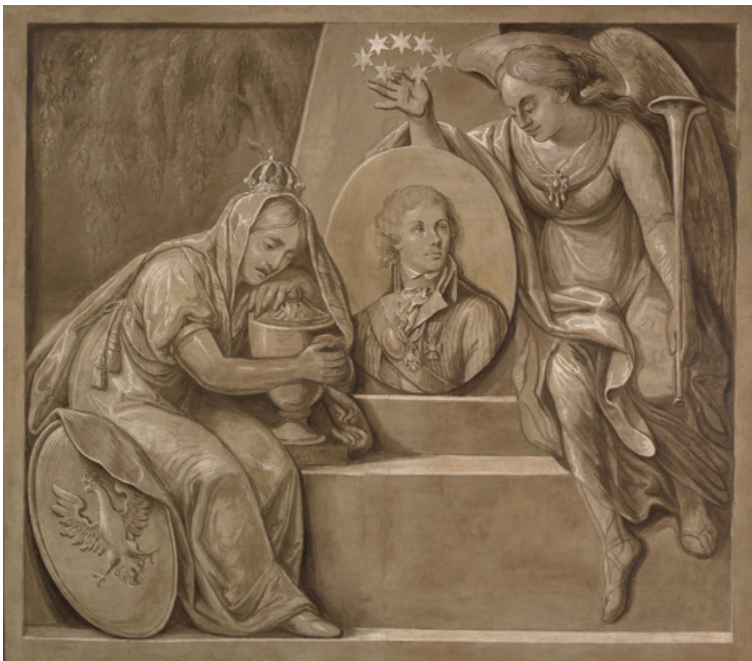
Apotheose von Kościuszko, Gemälde von Michał Stachowicz, 1818, Nationalmuseum Krakau

Kościuszko gehört zu den bedeutendsten Helden der Welt. Sein Charakter ist zu einem Symbol für Freiheit, Patriotismus und