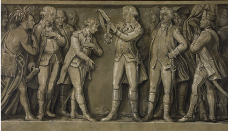
George Washington zeichnet Kościuszko mit dem Orden des Cincinnatus aus, Gemälde von Michał Stachowicz, 1818, Nationalmuseum Krakau