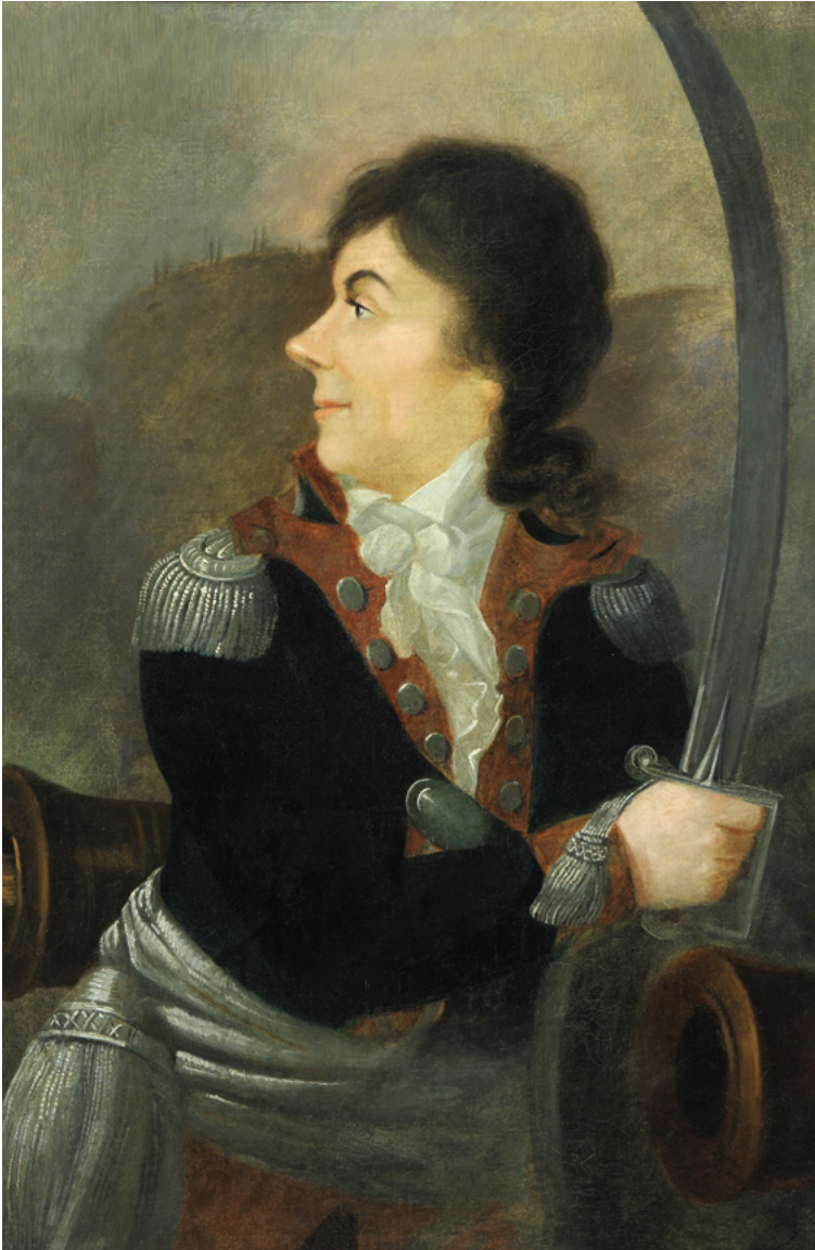
Porträt von Tadeusz Kościuszko, unbekannter Autor, ca. 1792, Museum der Polnischen Armee