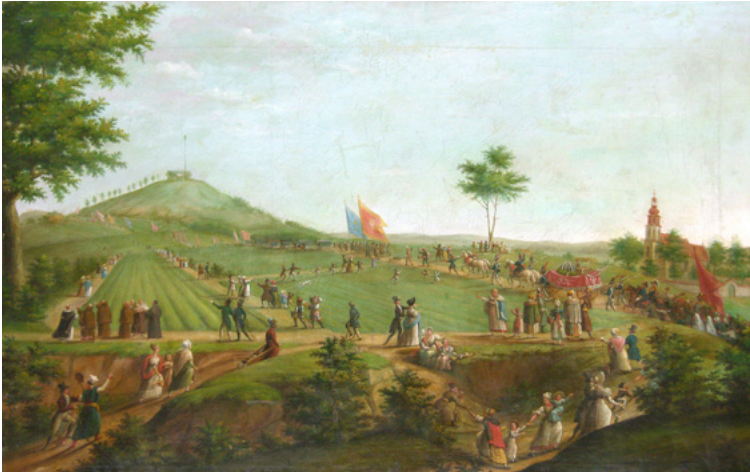
Parade mit Erde von Raclawice zum Kościuszko-Hügel in Krakau, Gemälde von Teodor Baltazar Stachowicz, 1859, Museum Krakau

Kościuszko-Motive waren auch in der Kunst sehr beliebt: Es entstanden zahlreiche Porträts von ihm, unter anderem von Benjamin West, Richard Cosway, William Sharp, Johann Frederik Martin, Jan Matejko und Wojciech Kossak. Bereits weniger als ein halbes Jahr nach seinem Tod, am 11. April 1818, brachte Fürst Antoni Jablonowski die sterblichen Überreste Kościuskos aus dem Schweizer Solothurn nach Krakau. Neun Wochen lang erwiesen die Krakauer und die umliegende Bevölkerung dem Helden die letzte Ehre. Am 23. Juni 1818 wurde sein Sarg in der Krypta des Heiligen Leonhard im Wawel-Dom beigesetzt, „an königlicher Seite“ – neben Johann III. Sobieski, Bezwiner der Türken in Wien 1683, und neben Fürst Józef Poniatowski, Marschall von Frankreich und Held der polnischen Nation.