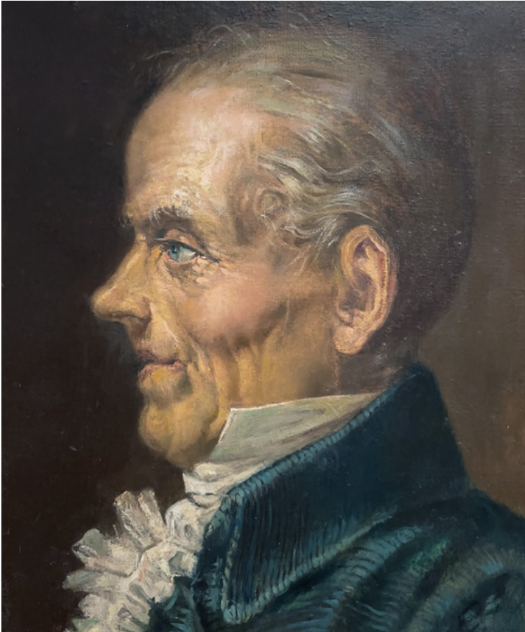
Porträt von Tadeusz Kościuszko, gemalt vom Komitee für den Kościuszko-Hügel, Krakau