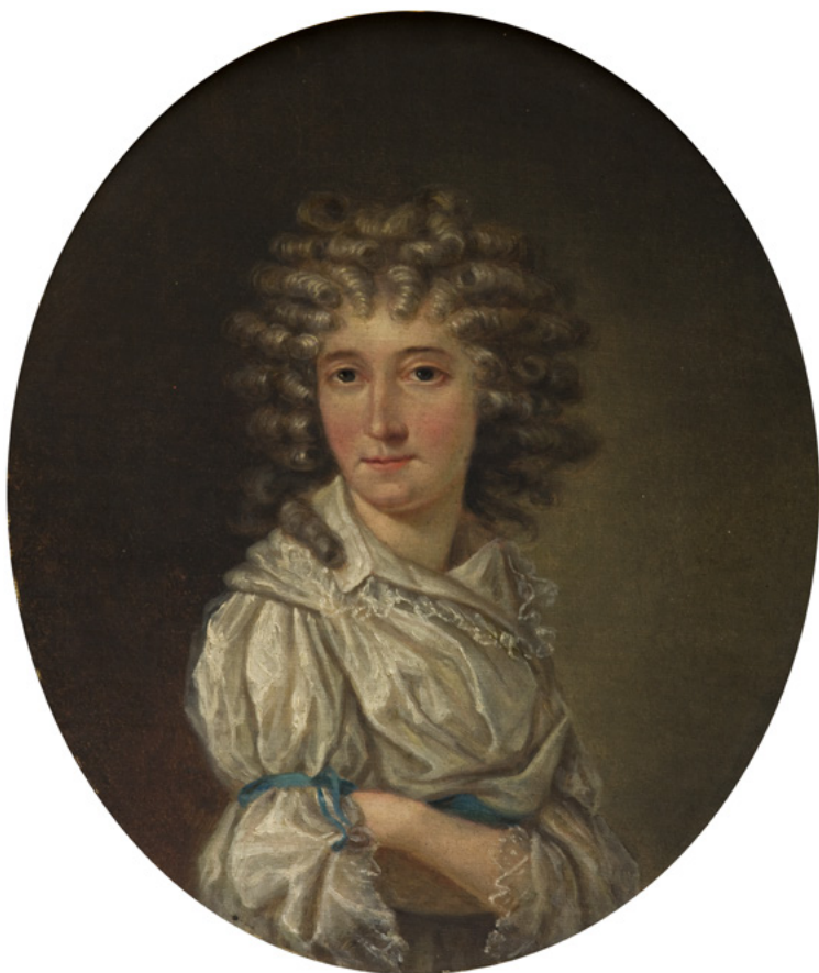
Porträt von Ludwika Sosnowska, unbekannter Autor, um 1775, Nationalmuseum Krakau