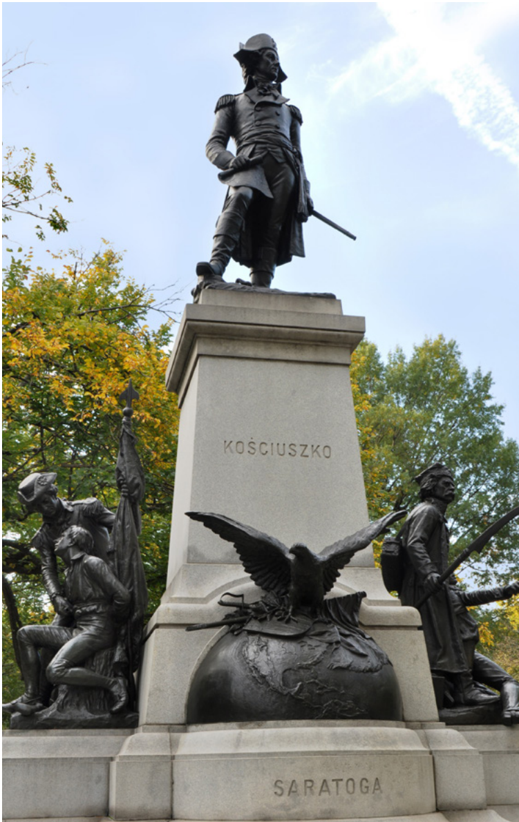
Kościuszko-Denkmal in Washington, Foto von Feliks Molski