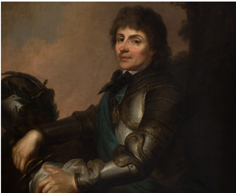
Porträt von Tadeusz Kościuszko in Rüstung, unbekannter Autor, Ende 18. Jh., Nationalmuseum Krakau

der Regierungsverfassung, die am 3. Mai 1791 verabschiedet wurde, einer der ersten Verfassungen der Welt. Durch die bewaffnete Intervention der russischen Truppen wurde die staatliche und militärische Reform Polens jedoch nicht umgesetzt. Im Januar 1793 führten Russland und Preußen die Zweite Teilung der Republik Polen durch. Ein Versuch, die Staatlichkeit zu retten, war der bewaffnete Aufstand unter der Führung von General Kościuszko, der am 24. März 1794 in Krakau ausbrach. Die Aufständischen kämpften fast acht Monate lang heldenhaft gegen die überlegenen russischen und preußischen Truppen. Der Aufstand wurde niedergeschlagen. Folge des Scheiterns des Aufstands war die Dritte Teilung, die 1795 von Russland, Österreich und Preußen durchgeführt wurde, sowie die Beseitigung der polnischen Staatlichkeit für 123 Jahre.