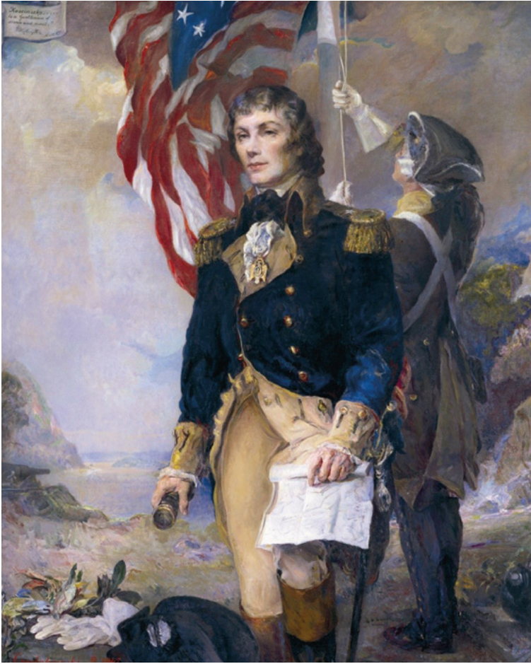
Porträt von Kościuszko in der Uniform eines Generals der US-Armee, mit Fort Clinton im Hintergrund, gemalt von Bolesław Jan Czedekowski, 1947, Kościuszko-Stiftung New York