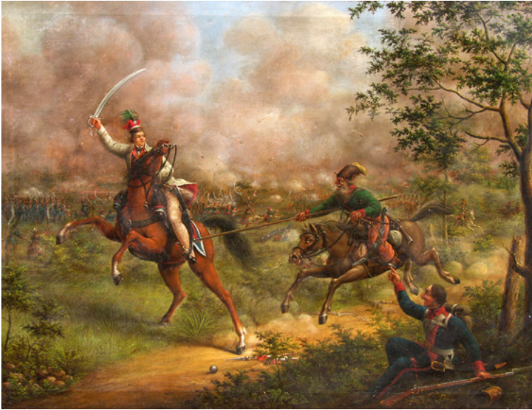
Kościuszko in Maciejowice, Gemälde von Teodor Baltazar Stachowicz, 1. Hälfte 19. Jh., Krakauer Museum

Vereinigung mit den Truppen des fähigsten russischen Befehlshabers, General Alexander Suworow, zu verhindern, zeugt von hoher strategischer Einsicht. Doch die Ausführung dieses Plans scheiterte vollständig. Kościuszko kämpfte als Befehlshaber mutig bis zum Schluss und wurde dabei schwer verletzt. Die Schlacht ging verloren, und Kościuszko geriet in russische Gefangenschaft. Einige Tage später trat bei ihm eine vorübergehende Lähmung des verletzten Beins auf; erst nach fast vier Jahren erlangte er seine Beweglichkeit zurück.